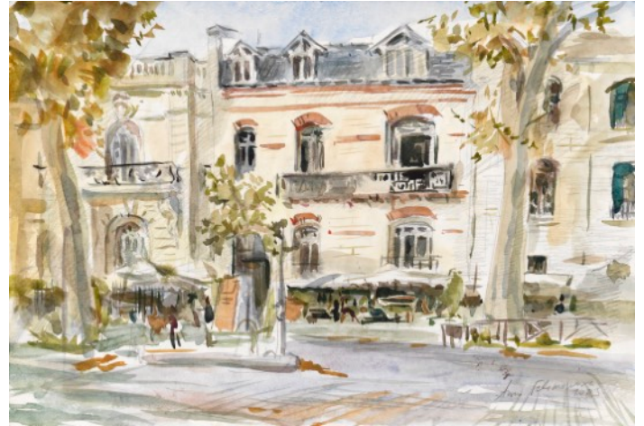
Anna Filimonova, Aquarelles

Le langage plastique d'Anna Filimonova (Née à Saint-Pétersbourg, vit à Paris) offre une nouvelle perception de la Capitale. Ses peintures de plein-air et ses vues prises sur le vif capturent l'atmosphère particulière de chaque quartier. Tantôt à l'aquarelle, tantôt à l'huile, ses tableaux parisiens transposent son ressenti dans un dessin léger révélant des paysages vivants et poétiques. "Dans ses tableaux, Anna Filimonova s'efforce de traduire non seulement le lieu, mais aussi et peut-être surtout, l'atmosphère qui y règne et qui l'a séduite." (Univers des Arts).